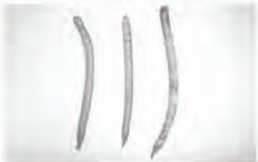
Figura 6. Izquierda y centro: vainas maduras. Derecha: vaina afectada por hongos