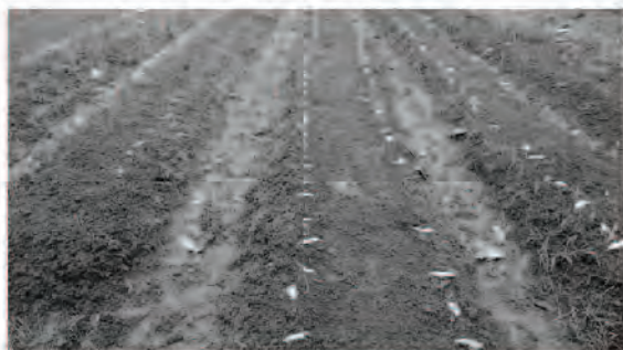
Figura 1. Germinación (7 días después de la siembra)

Una semana más tarde, el 80% de todas las plántulas de la variedad 8 (sumando la siembra y la resiembra) había desaparecido ya que las hormigas las empezaron a comer desde la emergencia. En vista que las demás variedades sólo estaban afectadas entre un 20% (variedad 1) y 0,3% (variedad 6) se procedió a hacer raleo, dejando en promedio una planta cada 15 cm, para una densidad de 133.333 plantas por hectárea.