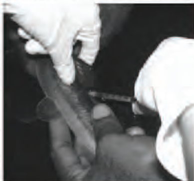
Foto 3. Proceso de inducción artificial. 2007.